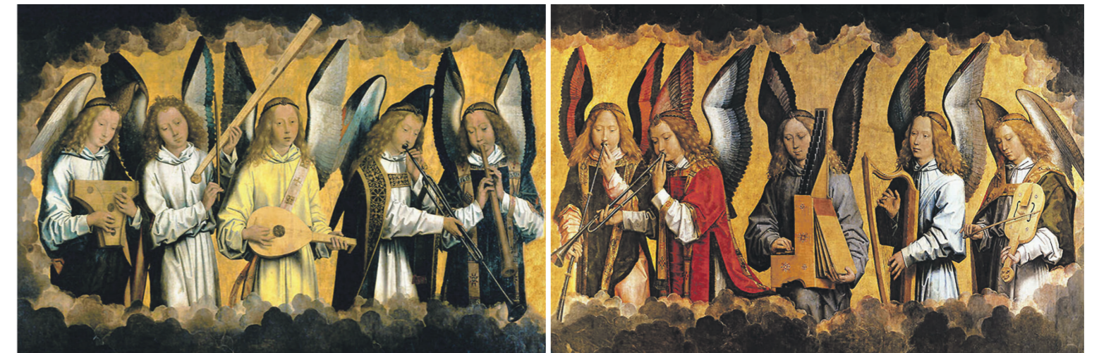
Hans Memling: Engelskonzert, um 1490, 165 x 672 cm, Öl auf Holz, linke und rechte Seite des erhaltenen Triptychons; Koninklijk Museum voor Schone Kunsten, Antwerpen